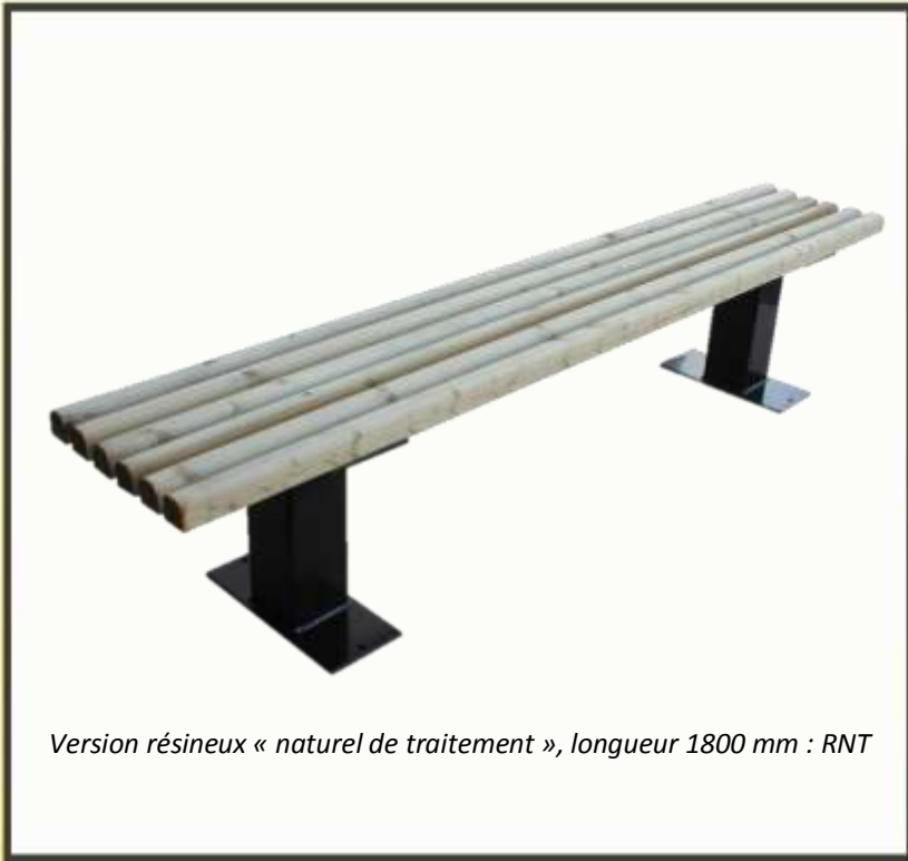
Version résineux « naturel de traitement », longueur 1800 mm : RNT